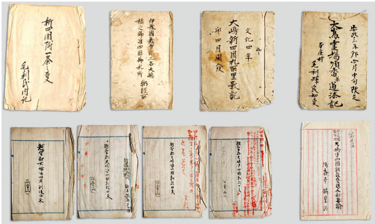
高龍寺所蔵資料（上段右から1、6、7、8、下段左から3、4）

※ 漢字は、原則として常用漢字および現代の通用字体に改めて翻刻した。また、読解の便宜のため、適宜句読点を付した。明らかに誤記と思われる箇所は〔ママ〕と記した