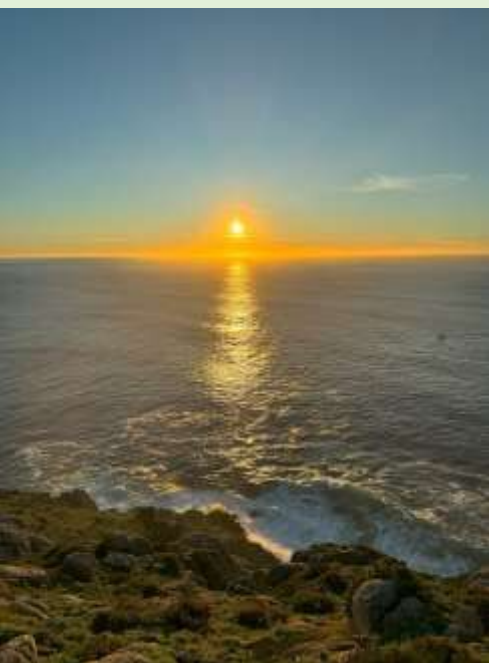
フィニステラの夕日

また、会場内では四国遍路に行かずとも同様の功德が得られるという「お砂踏み」を四国八十八ヶ所霊場会のご協力を得て、開催します。