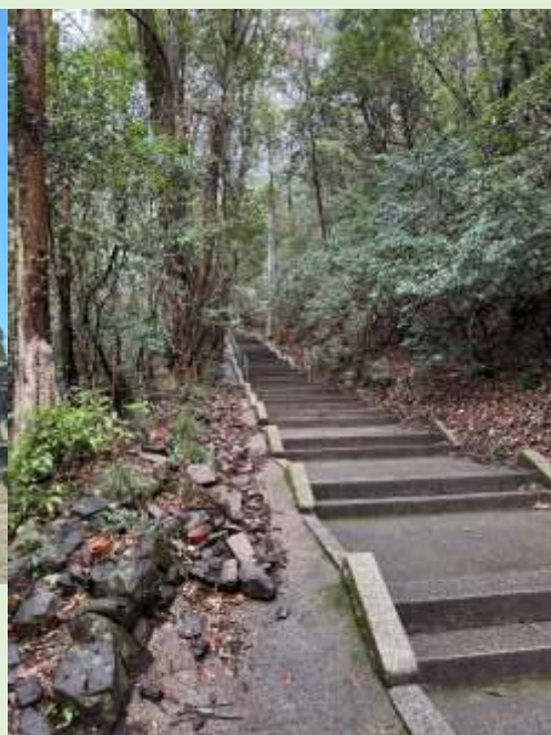
第七番札所谷寺の境内