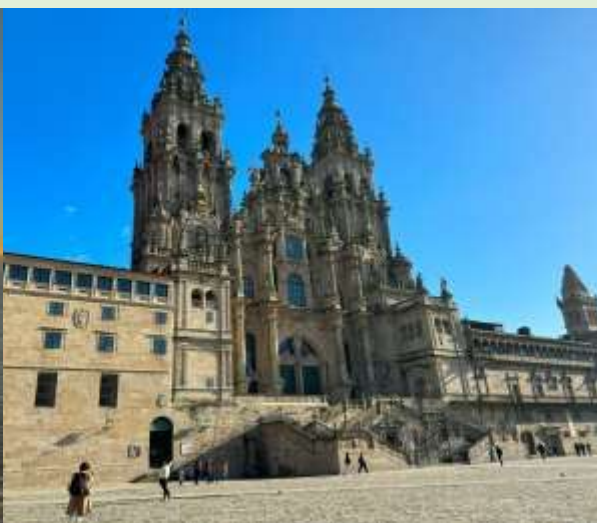
サンティアゴ・デ・コンポステーラ大聖堂