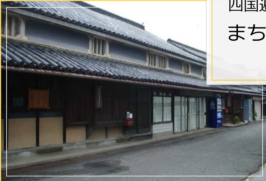
東かがわ市引田の町並み