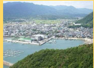
引田城跡からみた町の様子