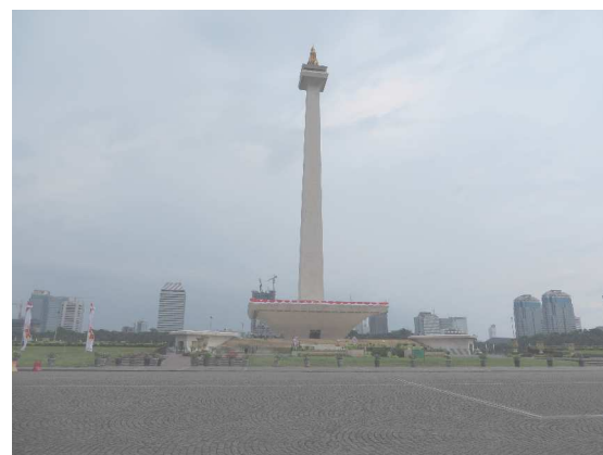
ジャカルタの独立広場