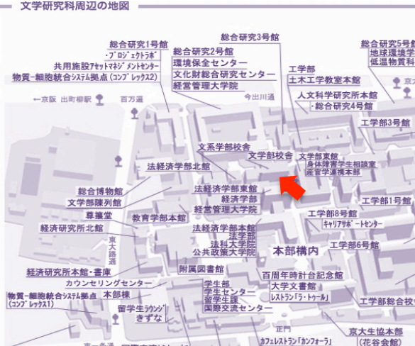
文学研究科周辺の地図