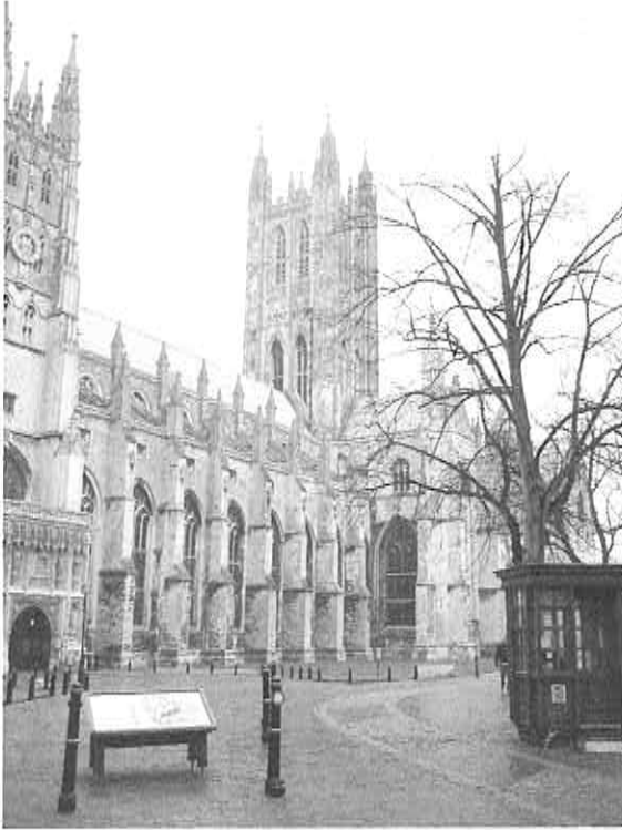
カンタベリー大聖堂