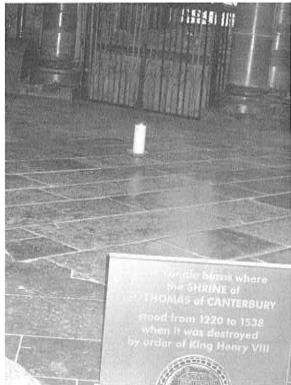
かつて聖トマスの霊廟のあった場所（トリニティ・チャペル）