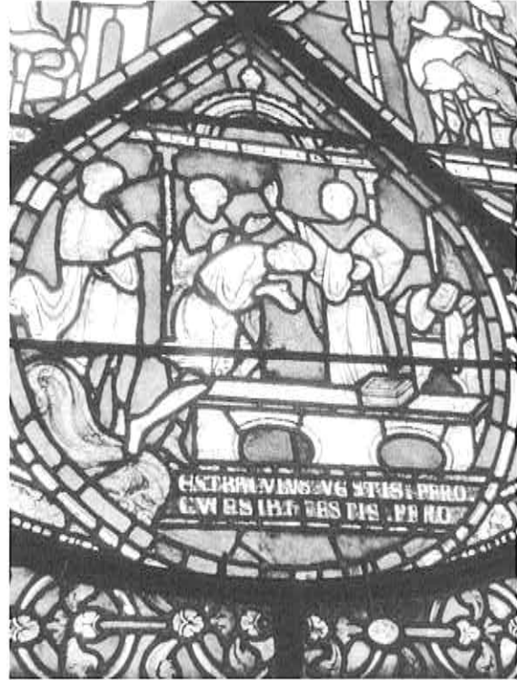
聖トマスの奇跡を表したステンドグラス